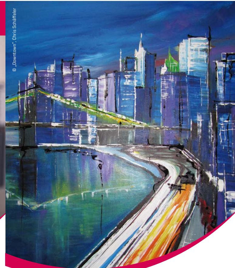
@ „Downtown“, Chris Schäffeler

Bernhard-Simonstrasse 6 · 7310 Bad Ragaz T +41 81 302 68 69 · F +41 81 302 64 34 info@schenkel-optik.ch · www.schenkel-optik.ch